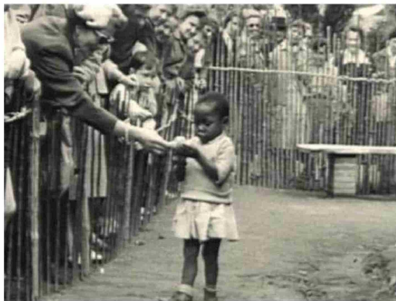
Una nena dentro de una cerca es visitada por cientos de personas que la observan con curiosidad. baartman todavía.

Los conceptos con los que se rigió hoy la humanidad no reina-