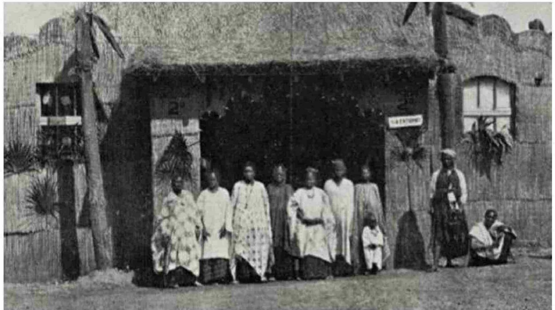
Un grupo de indígenas exhibidos en Europa.

Las personas se mostraban como mercadería junto a productos y plantas locales. Durante la exposición murieron cuatro de ellos. El apetito por esta diversión también mataba. Era la cúspide de la crueldad.