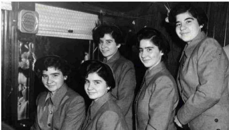
Había nacido Quintland (el país de las quintillizas), un parque de atracciones que atraía oleadas de visitantes. En 1937 Quintland fue el destino más concurrido del país, por encima de las Cataratas del Niágara.