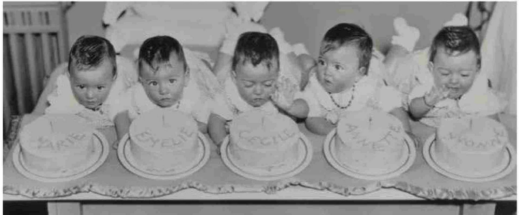
La mañana del 28 de mayo de 1934, en Corbell, Canadá, el doctor Allan Dafoe ayudó al nacimiento de quintillizas en una granja. Era un hecho inédito porque las pequeñas Dionne: Yvonne, Annette, Cécile, Emilie y Marie sobrevivieron.

El papá de las chicas, Oliva Dionne, estaba sumamente preocupado por los gastos para mantenerlas y le preguntó al sacerdote del lugar qué debía hacer, si mostrarlas por dinero o no. El cura apoyó la idea de hacerlo y se convirtió en su gestor comercial. El padre aceptó inicialmente que sus hijas fueran exhibidas en la feria mundial de Chicago y firmó el contrato. Aunque luego quiso cancelarlo, no pudo revertir el compromiso. Las cosas llegaron a tal punto que desde la oficina del Fiscal General de Ontario le propusieron a los padres ceder la custodia de las bebés a la Cruz Roja durante dos años. Para eso se construyó un hospital al otro lado de la calle, frente a la granja. Las bebés quedaron allí con un equipo de enfermeras. Sus padres Oliva y Elzire casi no podían verlas a solas. Eran señalados como campesinos ignorantes que no podían criarlas. Meses después, el primer ministro de Ontario propuso un proyecto de ley para quitarles la guarda de las menores y que estas pasaran a depender del estado argumentando que eso las iba a proteger de la explotación. El proyecto fue aprobado: serían criadas por el doctor Dafoe y las enfermeras. Pero el resultado no fue el objetivo que se había esgrimi-