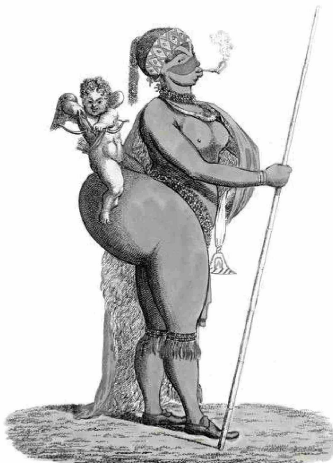
LOVE and BEAUTY -- SAARTJIE the HOTTENTOT VENUS.

Una vez en Europa, la comenzaron a llamar La Venus hotentote (el término 'hotentote' hoy es considerado despectivo porque es el que utilizaban los holandeses para describir a los grupos étnicos de los khoikhoi, khoisan o joisán) y fue obligada a desfilarse desnuda por una plataforma mientras hombres, mujeres y niños la observaban con intriga.