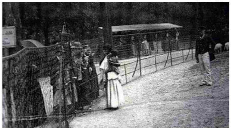
Africanas son exhibidas en ferias europeas.