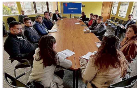
LA MESA DE SEGURIDAD SE REALIZÓ EN LA DELEGACIÓN PROVINCIAL.

Ayer en la delegación presidencial provincial, se realizó una mesa de seguridad escolar, que contó