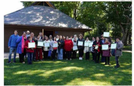
TREINTA FUERON LAS MUJERES CUIDADORAS BENEFICIADAS.