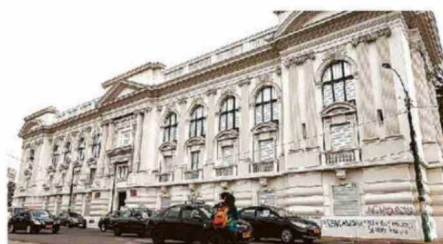
EN LA BIBLIOTECA SEVERÍN SE RESTAURARON PUERTAS Y VENTANAS.

zo un trabajo de conservación de ventanas y puertas. Son edificios complejos porque son monumentos nacionales, son muy antiguos porque requieren