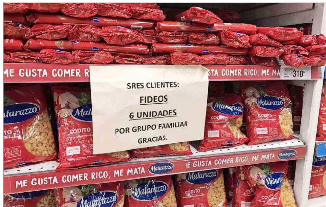
ABASTECIMIENTO. — Los supermercados (en la imagen, el local Carrefour) han redoblado las limitaciones para la compra de ciertos productos, que desaparecen de las estanterías por la masiva presencia de compradores chilenos.

Argentinos comienzan a advertir efectos del "boom de compras":