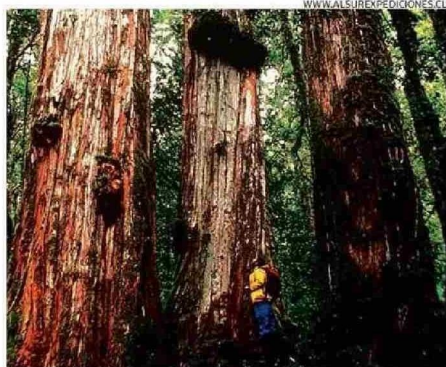
AL SUR EXPEDICIONES TE LLEVA AL PARQUE ALERCE ANDINO.

Puelo, Lago Todos los Santos, y ascensos a los volcanes Osorno, Calbuco o parques nacionales.