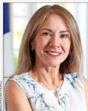
Susana Jiménez , presidenta de CPC.

Para la presidenta de la Confederación de la Producción y del Comercio (CPC), Susana Jiménez, el deterioro de los indicadores económicos es un factor de preocupación, y por eso espera "anuncios que permitan generar mejores condiciones para crecer, invertir y crear empleo. La última cifra de desempleo, que alcanzó 9,1%, hace imperativo avanzar en medidas que reactiven la inversión y permitan recuperar dinamismo económico. Hoy la principal urgencia es volver a generar oportunidades laborales para las cerca de 950 mil personas que buscan trabajo y también para los 2,5 millones de trabajadores que se desempeñan en la informalidad". En este sentido, sostiene que lo más relevante será "avanzar en medidas que impulsen la competitividad del país. Una reducción del impuesto corporativo hacia niveles más alineados con los estándares internacionales y una agenda decidida para agilizar los permisos sectoriales y ambientales pueden ayudar a destrabar proyectos, atraer inversión y generar más empleo".