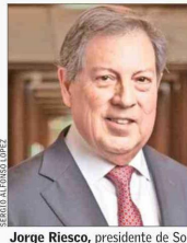
Jorge Riesco , presidente de Sonami.

El presidente de la Sociedad Nacional de Minería (Sonami), Jorge Riesco, valora positivamente la agenda que ha impulsado el Gobierno, y cree que recoge "parte importante de las inquietudes que el sector productivo ha venido planteando respecto de inversión, crecimiento y competitividad". Sin embargo, agrega, "para que Chile pueda realmente capitalizar el actual ciclo de precios del cobre y recuperar dinamismo económico, esperamos que la Cuenta Pública consolide una agenda clara de reactivación estructural y certezas para la inversión". Para lograr eso, cree que hay tres urgencias principales. Dos de ellas están relacionadas, pues cree que, en primer lugar, se debe "avanzar decididamente en la modernización del sistema de permisos y evaluación ambiental, reduciendo la permisología". En la misma línea, remarca que es importante "asegurar la certeza jurídica y la estabilidad regulatoria".