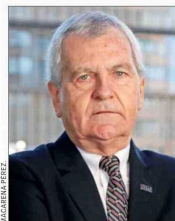
Alfredo Echavarría , presidente de la CChC.

En la Cámara Chilena de la Construcción (CChC), su presidente, Alfredo Echavarría, espera "un fuerte énfasis en aquellas medidas que permitan recuperar el crecimiento económico y generar más empleo formal. Chile acumula ya 40 meses con una tasa de desempleo superior al 8%, una situación que afecta directamente a miles de familias y que requiere acciones decididas para impulsar la inversión y la actividad económica". En este sentido, más allá de medidas completamente nuevas, dice, "una señal positiva sería reforzar y proyectar aquellas políticas públicas que ya han demostrado resultados concretos y un uso eficiente de los recursos fiscales". Se refiere al subsidio sobre la tasa de interés para créditos hipotecarios, y plantea que "una noticia muy bien recibida sería la extensión de la ley de subsidio a la tasa hipotecaria. Esta iniciativa ha permitido que miles de familias accedan a financiamiento para la compra de una vivienda, al mismo tiempo que ha contribuido a reducir el stock habitacional disponible".