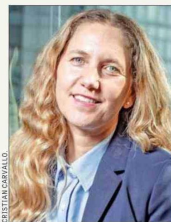
Rosario Navarro , presidenta de Sofofa.

La presidenta de Sofofa, Rosario Navarro, tiene un diagnóstico similar al que expresa la CPC, donde el tema de mayor preocupación es hoy día la crisis laboral derivada del estancamiento económico. En este sentido, la dirigente dice que "esperamos señales en ámbitos decisivos para recuperar crecimiento, inversión y confianza. Primero, fortalecer el empleo, la capacitación y la formación de capital humano. Chile enfrenta desafíos relevantes en informalidad, empleo juvenil y adaptación tecnológica, por lo que es importante avanzar en iniciativas que impulsen la empleabilidad, la reconversión laboral y una mejor articulación entre educación, empresa y desarrollo productivo". En lo específico, Navarro cree que una buena fórmula para comenzar a recomponer el deterioro del mercado laboral pasa por destrabar un elemento que ya forma parte de la agenda del Ejecutivo, pero con mayor celeridad: la reforma que amplía el acceso a sala cuna.