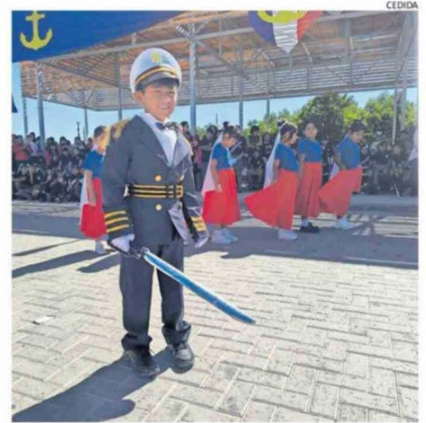
ESTUDIANTES RINDIERON HOMENAJE A LOS HÉROES DE IQUIQUE.