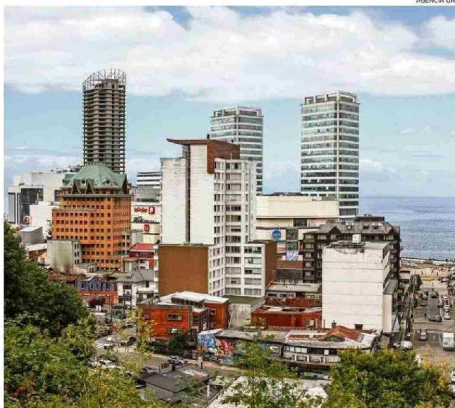
PUERTO MONTT RESALTÓ PARTICULARMENTE POR SUS CONDICIONES LABORALES Y AMBIENTE DE NEGOCIOS.

Finalmente, el jefe comunal de Puerto Montt expresó que "tenemos la confianza que podemos sacar adelante a Puerto Montt y mejorar la vida de nuestros vecinos".