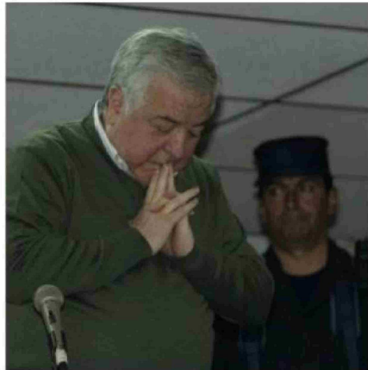
Gilberto Rodríguez Orejuela antes de ser extraditado a Estados Unidos.

italianos hacia Alemania, Polonia, Checoslovaquia. En pocos años, el Cartel de Cali dejó de ser una organización hemisférica para convertirse en una empresa global.