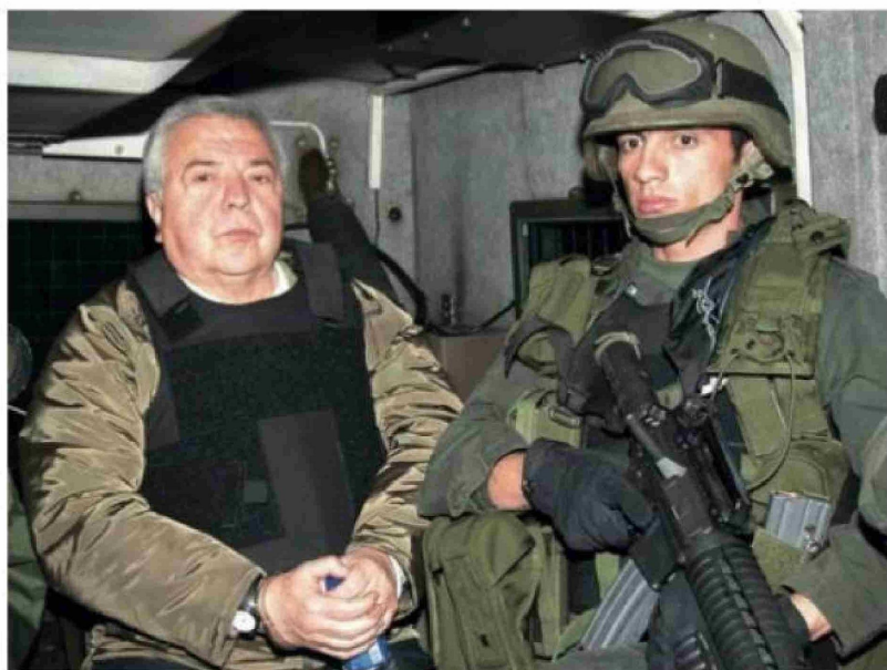
Gilberto Rodríguez Orejuela, jefe del Cártel de Cali, es escoltado por un policía colombiano antes de ser extraditado a Estados Unidos en Bogotá, Colombia, 3 de diciembre, 2004.

Junto a su hermano Miguel Rodríguez Orejuela y el también