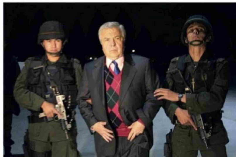
El acusado narcotraficante colombiano Gilberto Rodríguez Orejuela es escoltado por la policía en el aeropuerto militar de Catam, en Bogotá, Colombia, 12 de marzo, 2003.

alardes. En palabras de un funcionario de la DEA: "Las pandillas de Cali te matarán si es necesario... pero prefieren contratar a un abogado".