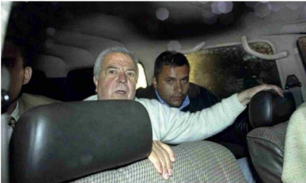
Gilberto Rodríguez Orejuela murió mientras estaba en una prisión de Estados Unidos.

Título: Crónica de la caída del capo del Cartel de Cali: el día que fue hallado detrás de un armario de su lujosa mansión