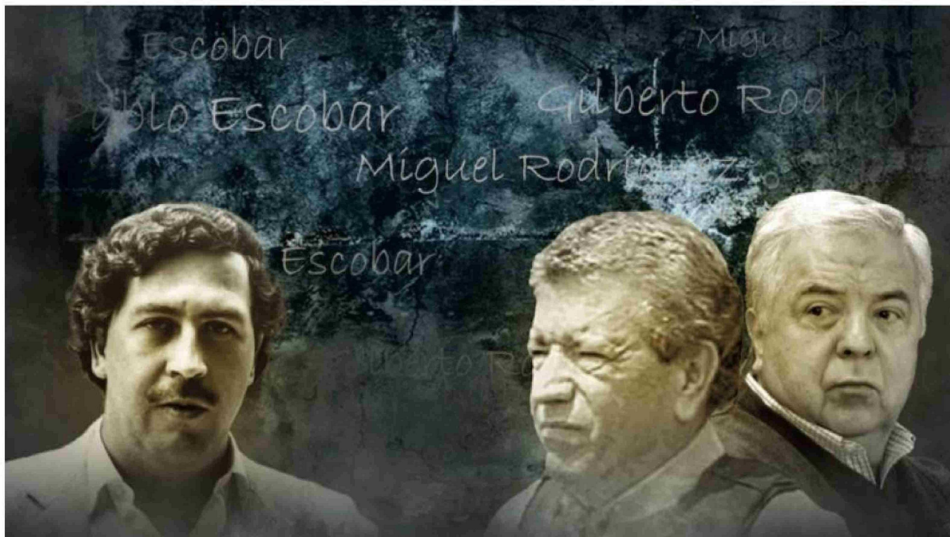
Pablo Escobar, líder del cartel de Medellín, y Miguel y Gilberto Rodríguez Orejuela, del Cartel de Cali.

Título: Crónica de la caída del capo del Cartel de Cali: el día que fue hallado detrás de un armario de su lujosa mansión