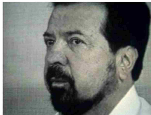
Gilberto Rodríguez Orejuela llevó la cocaína colombiana hasta Europa Oriental.