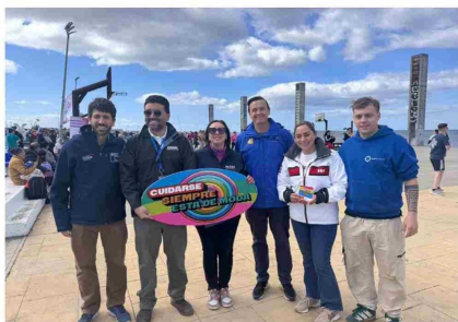
Las autoridades se hicieron presentes en la jornada.

que ya se preparan nuevos hitos, como el Día del Deporte el 11 de abril y la tradicional Corrida Nocturna para el 26 de julio.