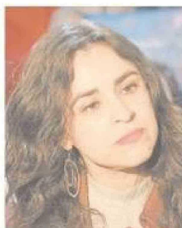
Diputada Javiera Morales.