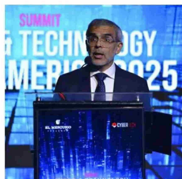
Luis Cordero, ministro de Seguridad Pública.