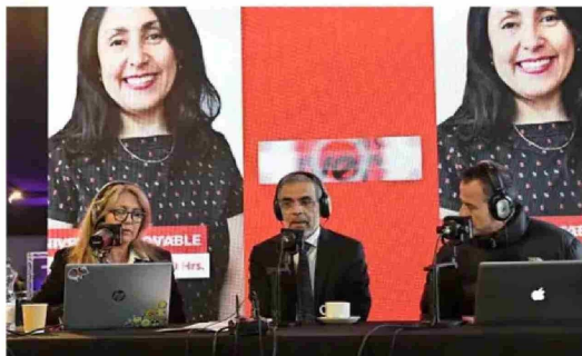
Gran parte de la programación de Radio Universo se realizó en los jardines de El Mercurio, dando así una completa cobertura al Cybertech & Technology South America 2025.