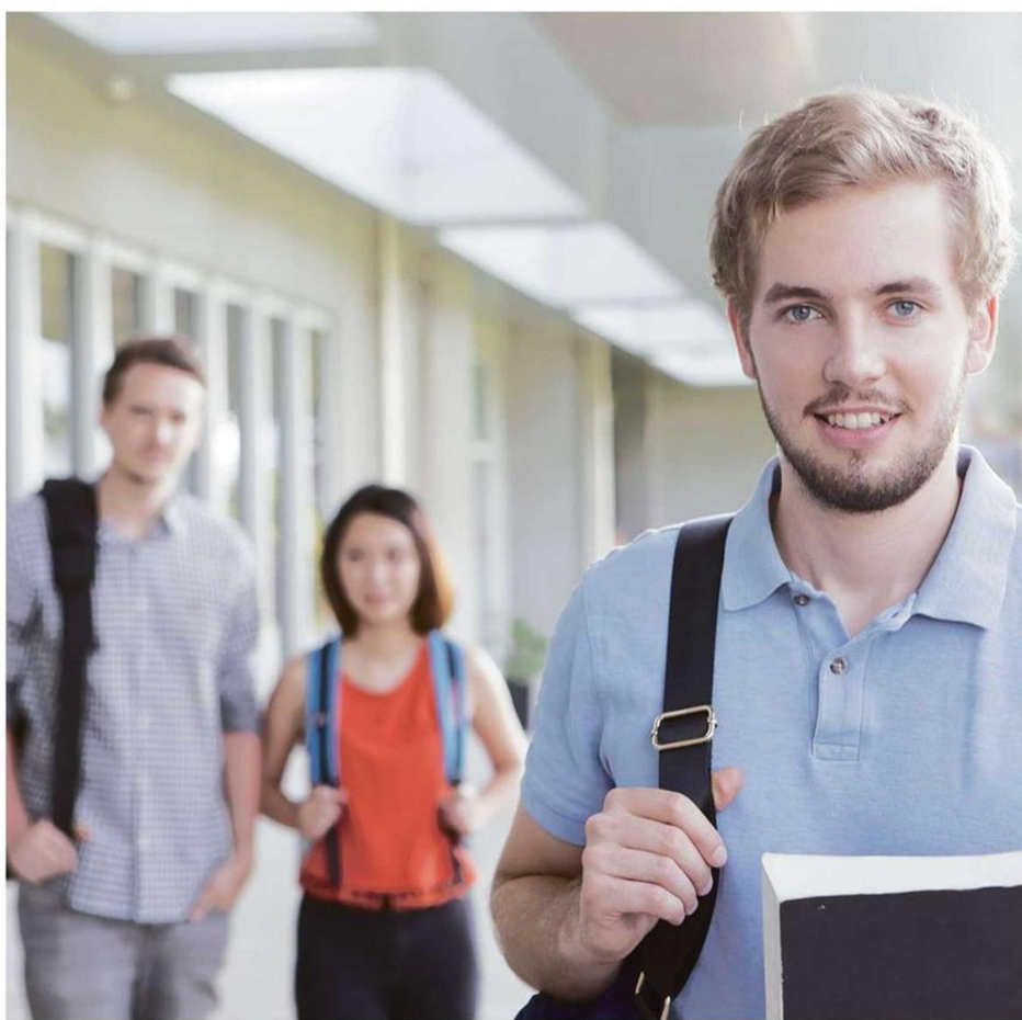
SEGÚN DATOS DEL MINEDUC, EN 2021 DOS DE CADA TRES ESTUDIANTES ACCEDIERON A ALGÚN TIPO DE AYUDA ESTATAL.

Es importante destacar que www.fuas.cl es la plataforma oficial y única para acceder a los beneficios a la educación superior y que al llenar el formulario único de acreditación socioeconómica e ingresar su postulación, los estudiantes podrán optar