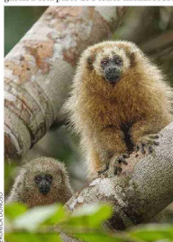
DIVERSO. Estos bosques también son hábitat de especies como monos y otras aves, como el celestino (foto inferior). Arriba, una pareja de colibríes de frente azul.

Hace unos 15 años, los pajareros que llegaban a esta parte de Perú lo hacían sobre