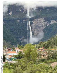
HITO. La catarata de Gocta es una de las más altas de Perú. En ese sector vive el picaflor "maravilloso".

todo siguiendo los datos de artículos de viaje o el boca a boca.