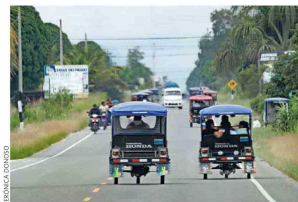
ruta. La ciudad de Tarapoto es el punto de partida de esta ruta, que se articula a lo largo de una carretera principal, llamada Fernando Belaúnde Terry. Al lado, coqueta de cresta roja, una de las 396 especies de picaflores que hay en América.