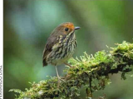
Antipitta de frente ocre.