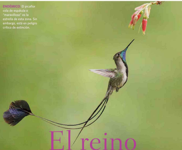
ENDÉMICO. El picaflor cola de espátula o "maravilloso" es la estrella de esta zona. Sin embargo, está en peligro crítico de extinción.