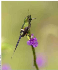
Coqueta de cola azul.

Tiraje: 126.654 Lectoría: 320.543 Favorabilidad: No Definida