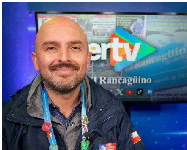
"La región hoy en día aporta cerca del 13% al Producto Interno Bruto (PIB) nacional", así lo destaca el jefe de la cartera.