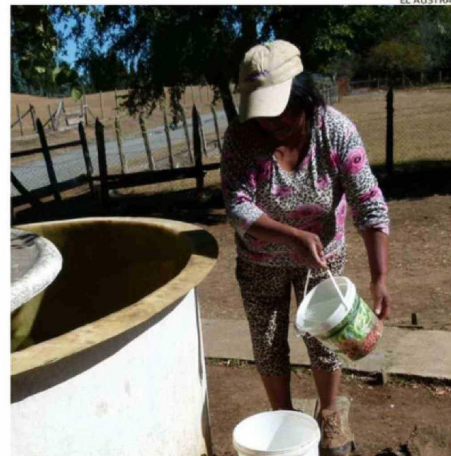
HASTA EL ACCESO AL AGUA EN LOS CAMPOS ES COMPLEJO CON EL ALZA.

ble, a nosotros nos afecta el triple, porque lo usamos para todo: generar electricidad, sacar agua, trasladarnos o abastecernos. Nadie parece considerarnos al diseñar políticas públicas, porque sólo se piensa en las zonas con mayor concentración de población. Hoy se gobierna pensando en la próxima elección y no en el desarrollo integral del país", afirmó.