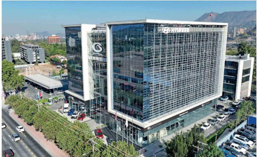
Edificio corporativo de Gildemeister en Las Condes, con oficinas y showroom exclusivo de Hyundai.

También se rediseñaron los servicios para distintos perfiles de clientes,