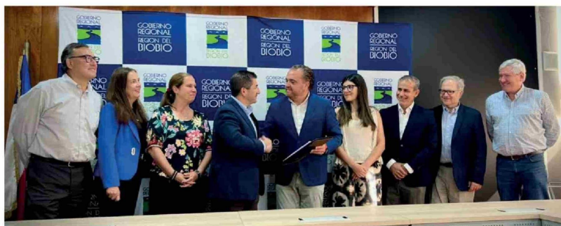
NUEVE ORGANIZACIONES EMPRESARIALES presentaron sus propuestas para el Plan Biobío 2050 con cinco ejes estratégicos.

bién como Estado nacional más que como un gobierno en particular", planteó.