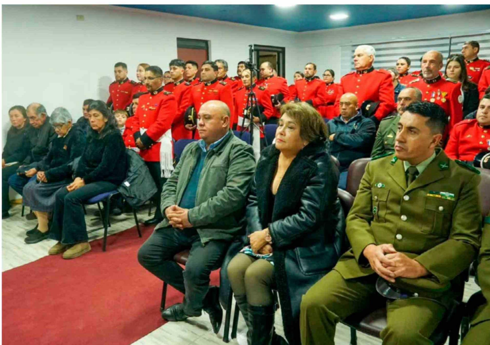
Fue una emotiva ceremonia donde se recordó el legado del comandante.