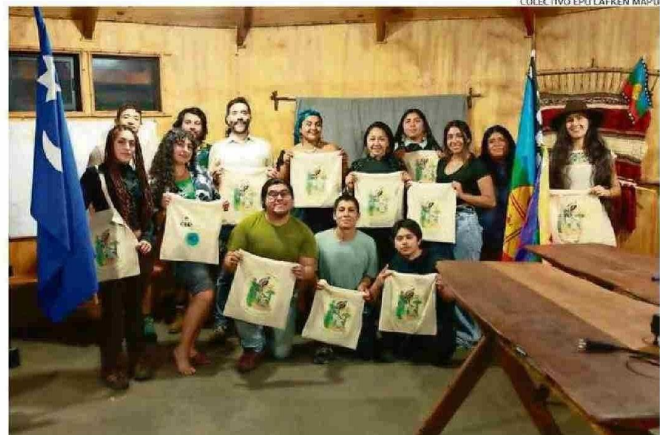
LA JORNADA FUE PARTE DEL V TRANSECTO INTERCULTURAL POR LOS RÍOS Y AGUAS LIBRES.

La jornada incluyó además el "V Transecto Intercultural por los Ríos y Aguas Libres", impulsado por el Colectivo Epu Lafken Mapu, una experiencia de monitoreo, navegación y observación que recorre el sistema hídrico desde su nacimiento en el lago Mülhue hasta su desembocadura en el lago Ranco.