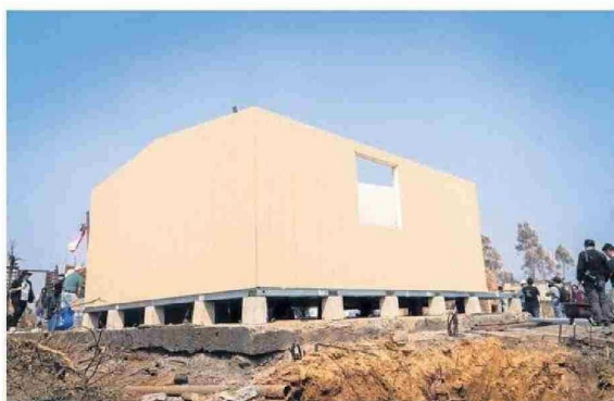
Las viviendas de emergencia tienen una superficie cercana a 24,27 metros cuadrados.