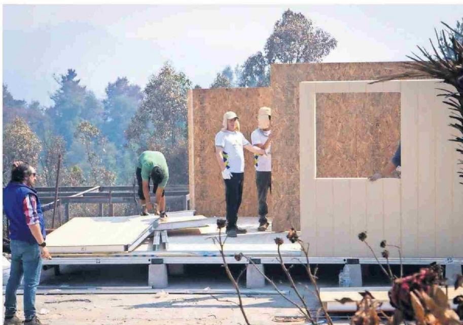
Prontamente se espera avanzar en sectores como El Pino, San Jorge y Las Pataguas, de la misma comuna.

Las soluciones habitacionales, de 24,27 metros cuadrados, contemplan paneles prefabricados de muros, techumbre inclinada con sistema de evacuación de aguas lluvias, elementos de hojalatería (botaguas), y se entregan con un