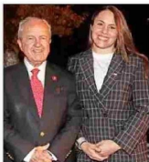
Miguel Ángel Mujica, presidente del Comité Olímpico de Chile, y Natalia Ducó, ministra del Deporte.