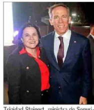
Trinidad Stainer, ministra de Seguridad Pública, y Jorge Alessandri, presidente de la Cámara de Diputados.