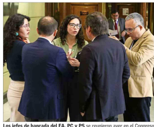
Los jefes de bancada del FA, PC y PS se reunieron ayer en el Congreso para abordar el ingreso de la propuesta.