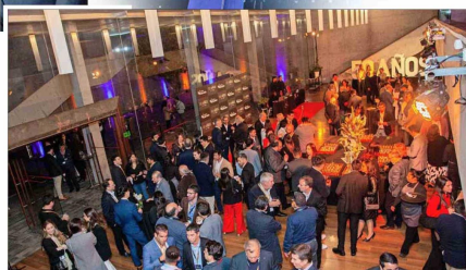
Más de 170 personas asistieron al encuentro.