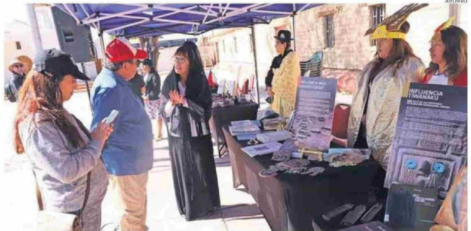
EN EL PARQUE EL LOA SE CONCENTRARÁN ALGUNAS DE LAS ACTIVIDADES Y MUESTRAS MÁS IMPORTANTES DE ESTA CELEBRACIÓN PATRIMONIAL.

Para más información se puede visitar la página www.dia-delospatrimonios.cl .