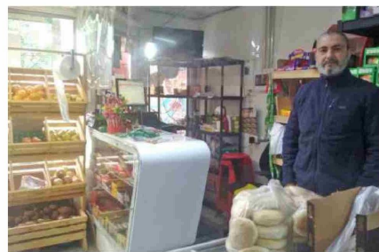
LAS BAJAS VENTAS HAN GOLPEADO CON FUERZA A LOS PEQUEÑOS COMERCIANTES DE PUNTA ARENAS.

acceso al financiamiento, producto de la coyuntura económica del país, y las dificultades en el suministro de vehículos de origen chino en la región.