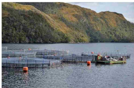
LA ACUICULTURA YA ANUNCIÓ UNA SEVERA REDUCCION DE SU COSECHA EN LA REGIÓN.

Tiraje: 5.200 Lectoría: 15.600 Favorabilidad: No Definida