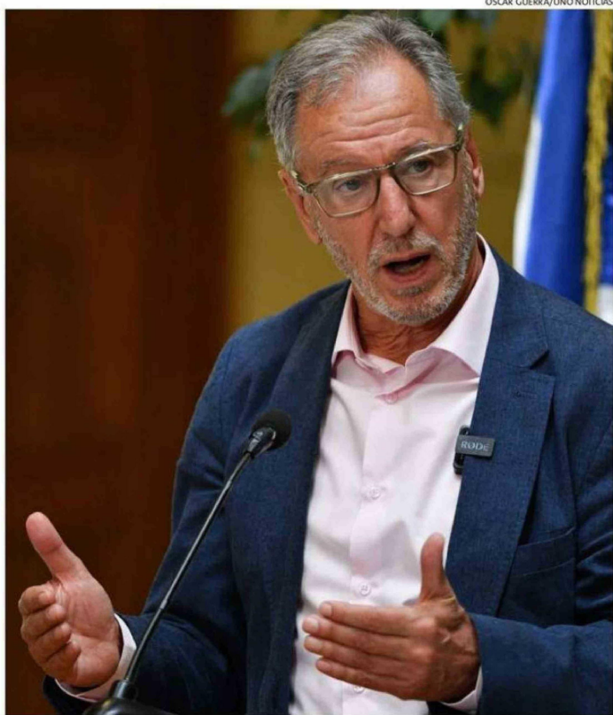
DESDE EL 21 DE AGOSTO DE 2025, ÁLVARO GARCÍA SE DESEMPEÑA COMO MINISTRO DE ECONOMÍA, FOMENTO Y TURISMO, Y DESDE EL 16 DE OCTUBRE, TAMBIÉN COMO TITULAR DE ENERGÍA.

- Señaló que en 2025 se ejecutó el 100% de lo comprometido en el Plan Económico Bicentenario Chiloé. ¿Cuáles considera que son los impac-