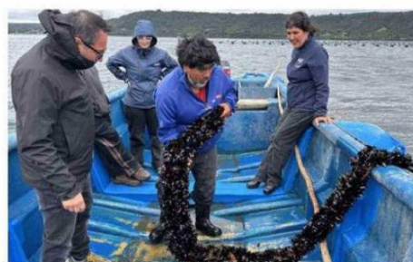
RESALTA APOYO A EMPRENDEDORES ACUICOLAS DE MENOR ESCALA.

Tenemos una ley en el parlamento, en su último trámite parlamentario, que busca atender precisamente eso, poner condiciones para la industria que promueve el turismo de aventura, que tiene un enorme potencial en nuestro país. Hemos sido reconocidos muchas veces como el principal destino de turismo aventura del mundo, pero es un sector bastante desregulado y eso es lo que busca hacer la ley, que esperamos pronto salga del parlamento; establece condiciones de seguridad para los turistas y, por lo tanto, obligaciones para las empresas que desarrollan esta actividad.