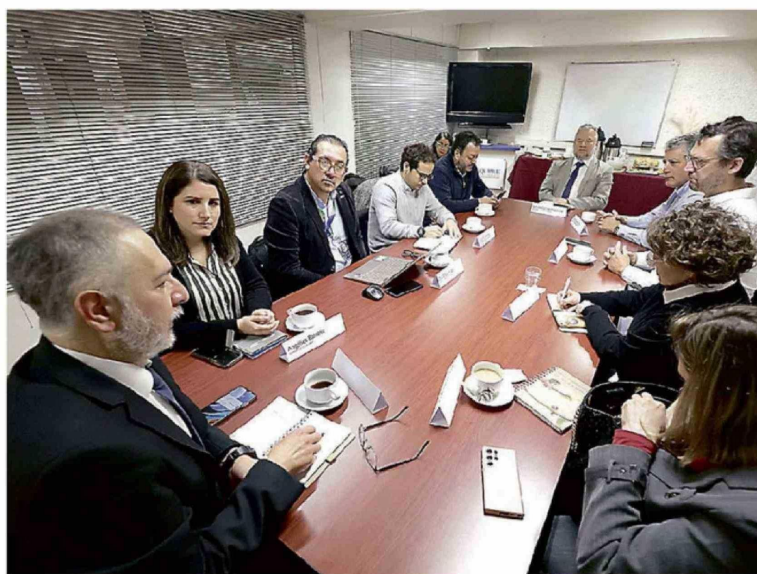
El conversatorio permitió reflexionar sobre el cambio cultural que implica la economía circular.

Durante el encuentro se abordó la necesidad de avanzar desde un modelo lineal de producción hacia uno donde los residuos puedan convertirse en nuevos insumos productivos, promoviendo así procesos más sostenibles y eficientes. Asimismo, se destacó la importancia de generar innovación y nuevos negocios asociados al reciclaje y la reutilización de materiales.