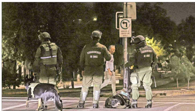
PIQUETES. — En la población Lo Hermida, en la comuna de Peñalolén, se realizaban controles de seguridad, para evitar protestas y barricadas ligadas al "29 de marzo".

De todas formas, entre la policía comentan que la situación se mantenía bajo control, lo que se sustentaba en el despliegue de personal de la 40ª Comisaría de Control de Orden Público (COP), que contaba con servicios reforzados y nuevas tácticas de detención en eventos masi-