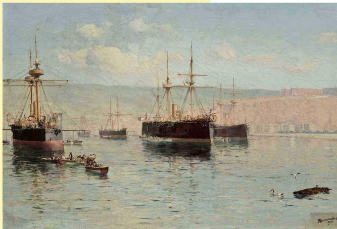
Thomas Somerscales: "Escuadra chilena en Valparaíso".