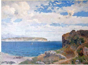
Pedro Lira, "Paisaje marino". Una de sus pinturas más originales.