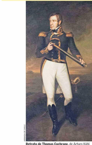
Retrato de Thomas Cochrane, de Arturo Kühl.