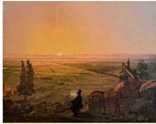
Cicarelli: "Vista de Santiago desde Peñalolén". Una de las pinturas que sobresalen en el patrimonio del Santander Chile.