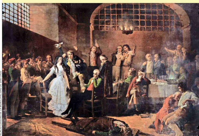
Monvoisin: "La última cena de los Girondinos", 1840. Gran pintura del maestro francés, que refleja los temas de su época. El Palacio Cousiño tiene cuatro notables cuadros del artista.