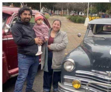
UNA PAREJA JUNTO A SU HIJA DISFRUTANDO DE LA CULTURA.

“Esta muestra de automóviles es una maravilla. Uno se toma fotografías con todos los vehículos y los niños son quienes más disfrutan, aunque los que somos aficionados a los motores también estamos felices. Me llama la atención lo ordenados que están los recorridos y cómo en cada recinto existen actividades. Todo está muy bien cuidado. Osorno es una ciudad muy bonita, pero siento que se difunde poco todo lo que tiene para ofrecer. Por ejemplo, visitamos varios museos solamente porque revisamos el programa del Día del Patrimonio”, señaló.