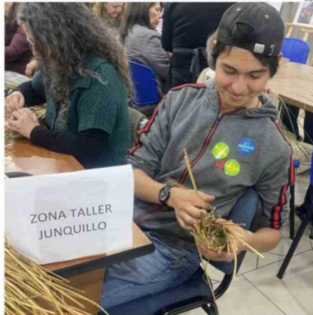
DISTINTOS TALLERES SE REALIZARON EN LA PINACOTECA Y BIBLIOTECA.

Día de Los Patrimonios, para abarcar las distintas culturas y tradiciones presentes en el país. Continuará realizándose el último fin de semana del mes de mayo.