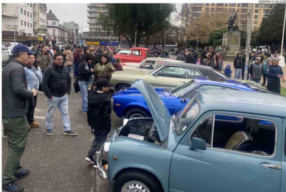
LA EXHIBICIÓN DE AUTOMÓVILES ANTIGUOS REALIZADA AYER EN LA PLAZA DE ARMAS FUE DE LAS VISITADAS DURANTE EL FIN DE SEMANA.

Una de las actividades que mayor cantidad de público congregó fue la exhibición de más de 20 automóviles antiguos realizada ayer entre las 12.30 y las 14 horas en la plaza de Ar-