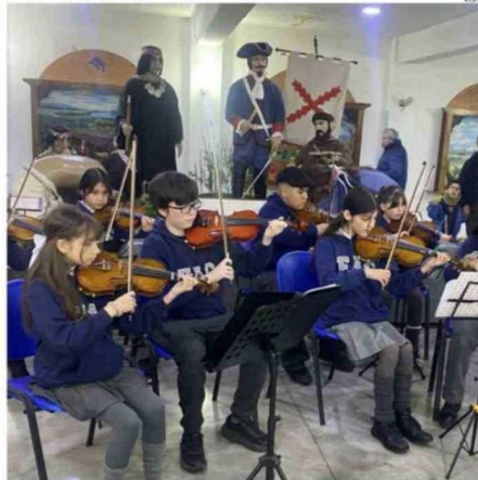
LA BANDA DE LA ESCUELA DE LAS ARTES EN EL FUERTE REINA LUISA.