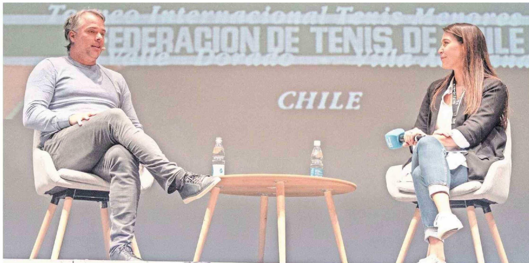
El destacado ex tenista nacional Fernando González también fue parte de la instancia contando su experiencia como inversionista.

Tiraje: 10.000 Lectoría: 30.000 Favorabilidad: No Definida