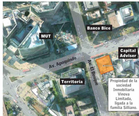
Propiedad de la sociedad Inmobiliaria Vinova Limitada, ligada a la familia Sillano.

Con un valor de entre 1,4 y 1,6 UF por m 2 , un largo conflicto judicial y la negativa de sus dueños a vender, es "una isla" en medio del desarrollo inmobiliario del sector.