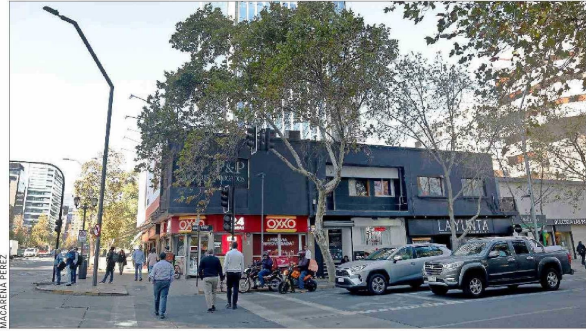
Esquina sur de Apoquindo con El Bosque.

Protopsaltis recalca que hoy el inmueble se encuentra completamente libre de restriccio-