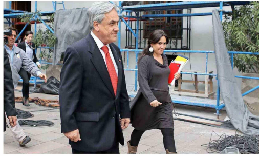
"Me encantaba trabajar con mi papá y me encantaba la política, pero siempre en un segundo lugar", dice.