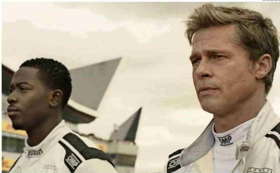
LA PELÍCULA ES PROTAGONIZADA POR BRAD PITT COMO SONNY HAYES Y DAMSON IDRIS COMO JOSHUA PEARCE.

Resultó que Hollywood fue un poco más fácil de convencer para hacer la película que la F1. Para cuando Kosinski y el productor Jerry Bruckheimer se pusieron en contacto con ellos, Pitt ya había aceptado protagonizar la película y habían decidido trabajar con Apple para que les ayudara a alcanzar