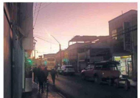
TRAS EL TERREMOTO GRAN PARTE DE CALAMA ESTUVO SIN ELECTRICIDAD.

La autoridad agregó que la principal preocupación se con-