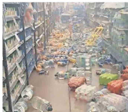
UNA EVIDENCIA DE LA MAGNITUD DEL SISMO EN UN SUPERMERCADO.