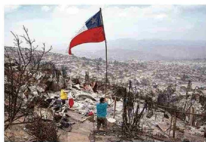
POBLACIONES COMPLETAS SE QUEMARON POR EL MEGAINCENDIO.