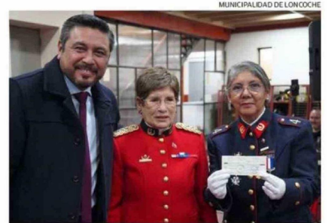
MUNICIPALIDAD DE LONCOCHE MUNICIPIO DE LONCOCHE ENTREGA CERCA DE $48 MILLONES A BOMBEROS EN HISTÓRICA SUBVENCIÓN ANUAL.