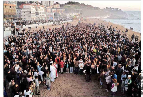
En la foto, el tradicional Vía Crucis en la playa de Reñaca.

con recorridos por calles, rutas y cerros, que en la mayoría de los casos comenzaron a las 19:00 horas para finalizar en santuarios, parroquias y catedrales. Eso último, en Arica, incluyó los alrededores del histórico Morro, en el centro de la ciudad. Mientras que en Punta Arenas, en el otro extremo del país, las actividades se replicaron en el Cerro de la Cruz.