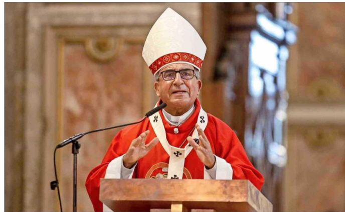
LITURGIA. — El arzobispo de Santiago presidió la Liturgia de la Pasión del Señor, centrada en la proclamación de la Pasión y la adoración de la Cruz, en la Catedral Metropolitana.

Asimismo, indicó que "vemos la cruz en esos migrantes maltratados en todas partes del mundo y que han muerto buscando nuevos horizontes", también "en esos presos a los cuales se les priva de la mínima dignidad. Vemos esa cruz en ese hombre que no tiene trabajo y ve con dolor como su familia pasa hambre" y "en esos niños y ancianos que han muerto en la guerra".