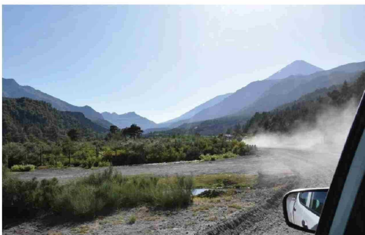
DURANTE LA TEMPORADA ALTA de visitas se mantendrá el sistema de ticket digital.