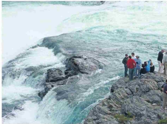
Salto del río Baker.

Uno de los ejes naturales que estructuran el proceso colonizador es el río Baker, el más caudaloso de Chile y uno de los más largos del país. Nace en el lago Bertrand que, a su vez, es desagüe del magnífico lago General Carrera. En su recorrido de 170 km, el Baker y sus ríos tributarios (Cañal, Delta o Leones, Nef, río de la Colonia, Chacabuco, El Salto, río de Los Nadis, Ventisquero y Cochrane) estructuran una secuencia de paisajes fluviales definidos por cauces de agua, el relieve de los sistemas cordilleranos