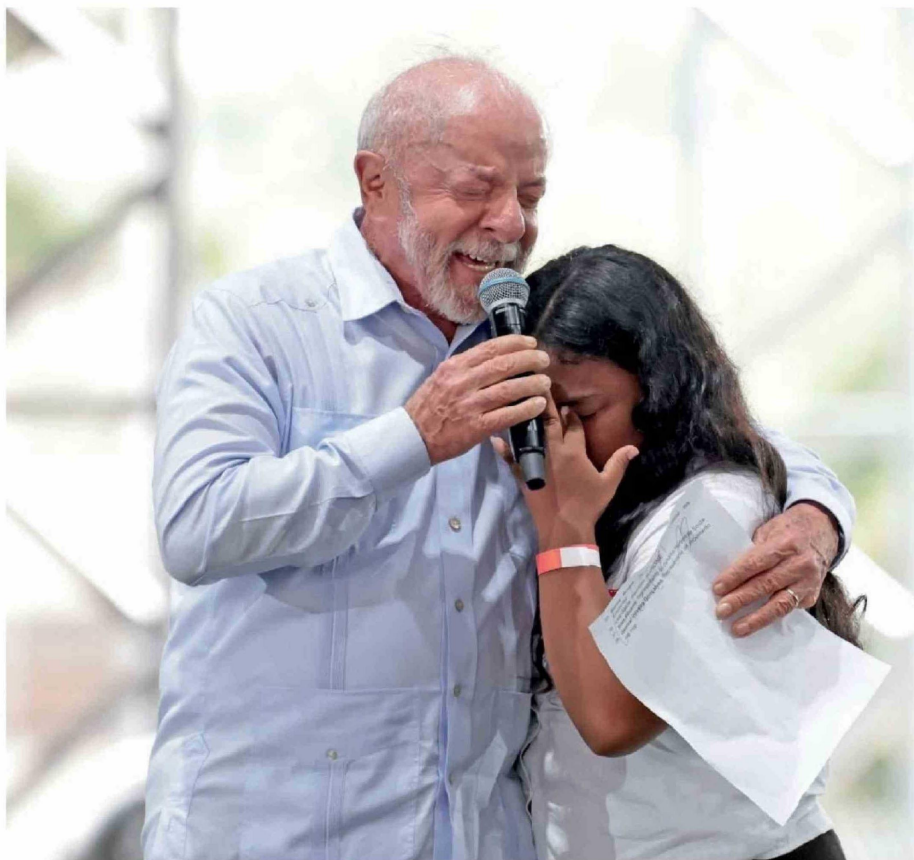
► Lula participa de una ceremonia de celebración de la Ley de Cuotas, en Anhembi, Sao Paulo, en marzo pasado.