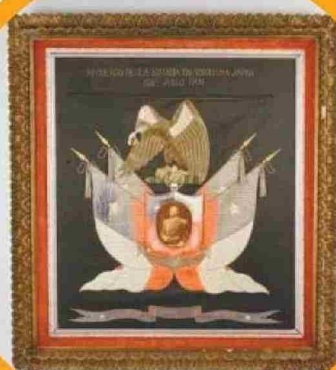
CUADRO DE PRAT ENTREGADO EN 1908 A CORBETA BAQUEDANO.

descansan los espíritus de los guerreros japoneses. "No es un cementerio, pero están los kamis. Un kami es el espíritu de un guerrero que luego de su propósito de vida llegan a ese estado. Ahí están los nombres de las personas que lucharon por la grandeza de Japón".