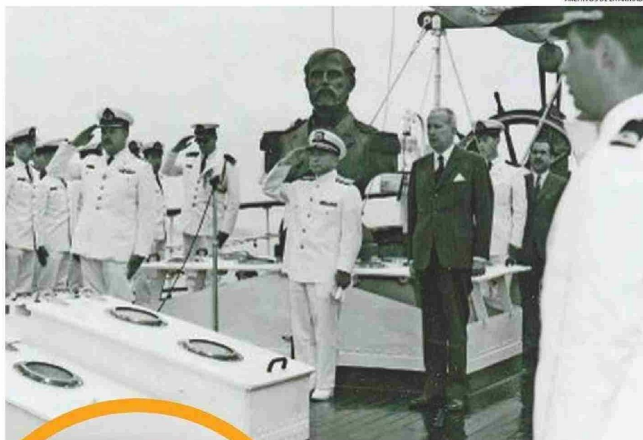
ARCHIVOS DE LA ARMADA

Yasukuni significa "tierra de paz" y es ahí donde