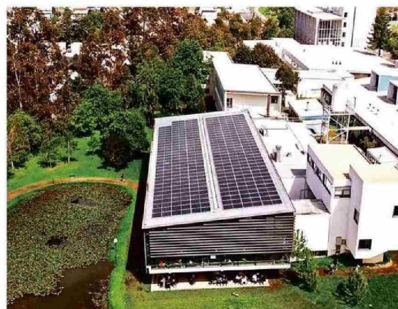
El campus San Juan Pablo II con sus paneles fotovoltaicos.

“Buscamos dejar una huella en cada estudiante, académico y trabajador promoviendo una cultura donde todos y todas se reconozcan como agentes de cambio”