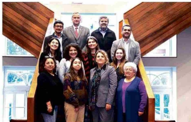
El Consejo de Sustentabilidad articula el trabajo de la UCT en estas materias.

Así es como en los últimos años se han inaugurado diversos edificios con sello verde, entre ellos el Pabellón Docente y el Campus Nuestra Señora de Lourdes (que alberga el Hospital de Simulacón), espacios que reflejan cómo la universidad ha ido adaptan-