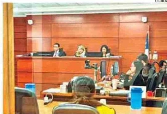
AUDIENCIA DE LECTURA DE SENTENCIA DE LA IMPUTADA.