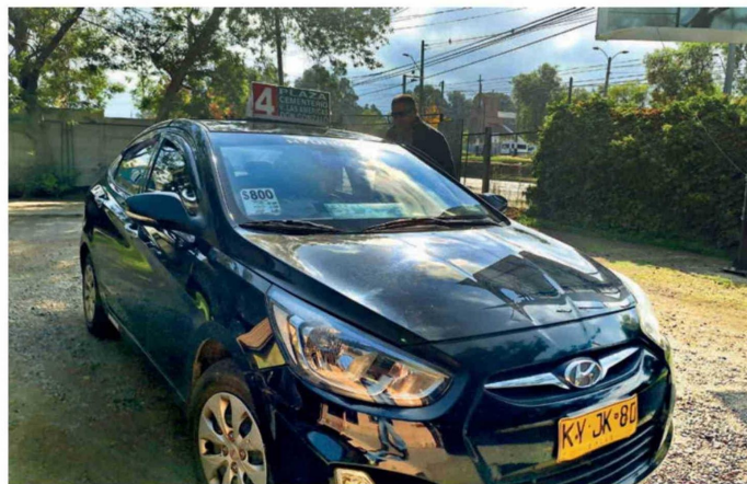
Avelino Miño llega a marcar tarjeta en el terminal de la Línea 4.

Avelino Miño llega a marcar tarjeta en el terminal de la Línea 4. Perteneció al equipo de los dueños que conducen su propio vehículo, en su caso un petrolero. Se nota que, transcurridas varias semanas desde el alza en el precio del combustible, ya ha sacado las cuentas. Está pagando 9 mil pesos diarios más de lo que gastaba antes del aumento. Un bencinero, en tanto, debe haber su-