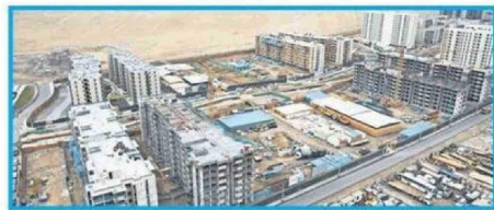
EL PRESIDENTE JOSÉ ANTONIO KAST PRESENTÓ LAS MEDIDAS DEL PROYECTO DE LEY PARA LA RECONSTRUCCIÓN NACIONAL Y DESARROLLO ECONÓMICO.

Eliminación a contribuciones a la primera vivienda para personas mayores de 65 años