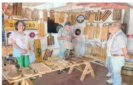
En el pueblito se pueden encontrar creaciones en madera, joyería, tejidos, mermeladas y una variada muestra del trabajo hecho a mano que refleja la historia, el oficio y el cariño de quienes habitan este territorio.