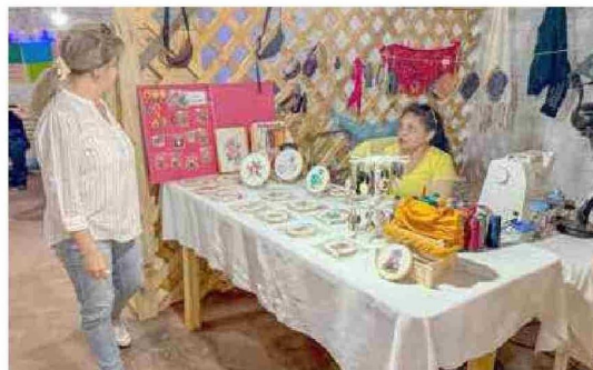
El espacio ofrece a los visitantes y vecinos una experiencia auténtica, profundamente enraizada en la ruralidad y en la identidad costera de Constitución.

fuerzo y su identidad. Papihua y todo el sector sur costero tienen una riqueza cultural enorme, y este espacio viene a consolidar esa vocación. Como municipio estamos muy felices de haber apoyado este proyecto y seguiremos trabajando para que nuestros artesanos tengan las condiciones que merecen. Invitamos a la comunidad y a los turistas a venir, conocer y preferir este hermoso lugar", expresó.