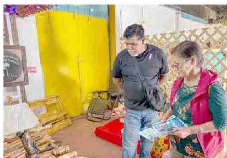
Los artesanos pueden mostrar productos de primera calidad, hechos con identidad y con amor por esta bella tierra maquina.