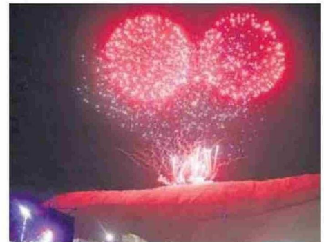
CON FUEGOS ARTIFICIALES CELEBRARON EL CUMPLEAÑOS DE CHUQUI.