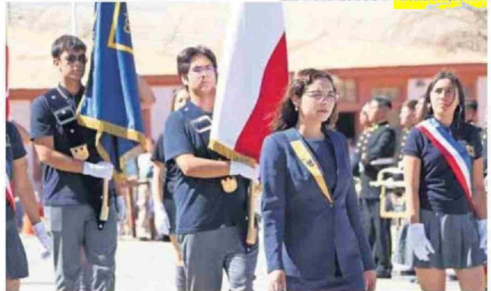
ESTABLECIMIENTOS EDUCACIONALES DE CALAMA PARTICIPARON DEL DESFILE CÍVICO-MILITAR.