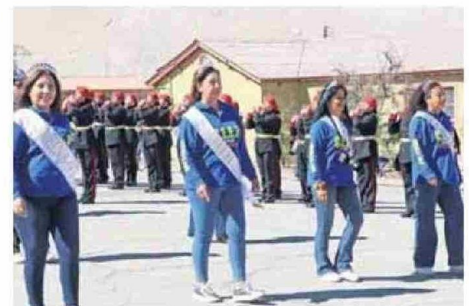
ALGUNAS DE LAS REINAS QUE TUVO EL CLUB ¿CUÁL E' EL PROBLEMA?.