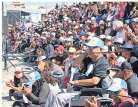
CIENTOS DE PERSONAS LLEGARON A PARTICIPAR DE LAS ACTIVIDADES.

CONMEMORACIÓN. Durante tres días, los exhabitantes llegaron de nuevo al casco histórico del mineral para celebrar los 110 años de historia.