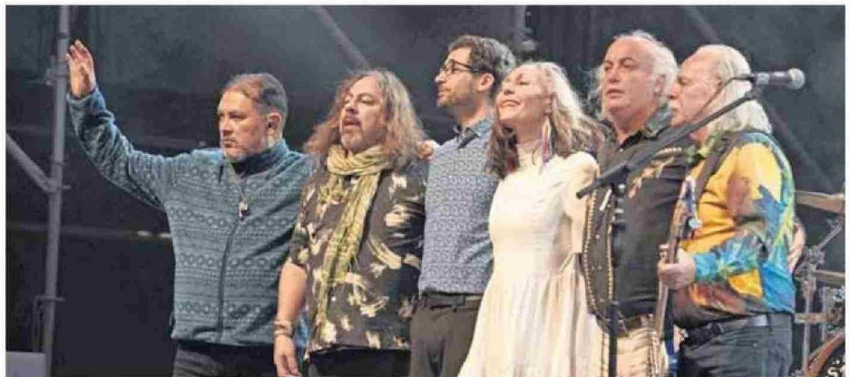
LOS JAIVAS FUERON LOS ENCARGADOS DE INICIAR LOS FESTEJOS DE VÍSPERA DEL 18 DE MAYO, DÍA NACIONAL DE CHUQUICAMATINO.