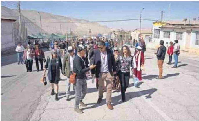
LAS ACTIVIDADES COMENZARON CON LA APERTURA DE LAS PUERTAS DEL EXCAMPAMENTO.

Tiraje: 2.400 Lectoría: 7.200 Favorabilidad: Neutra